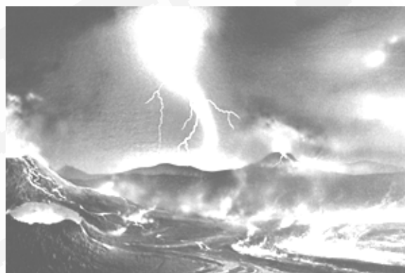
Fig. 2: Terra Primitiva.